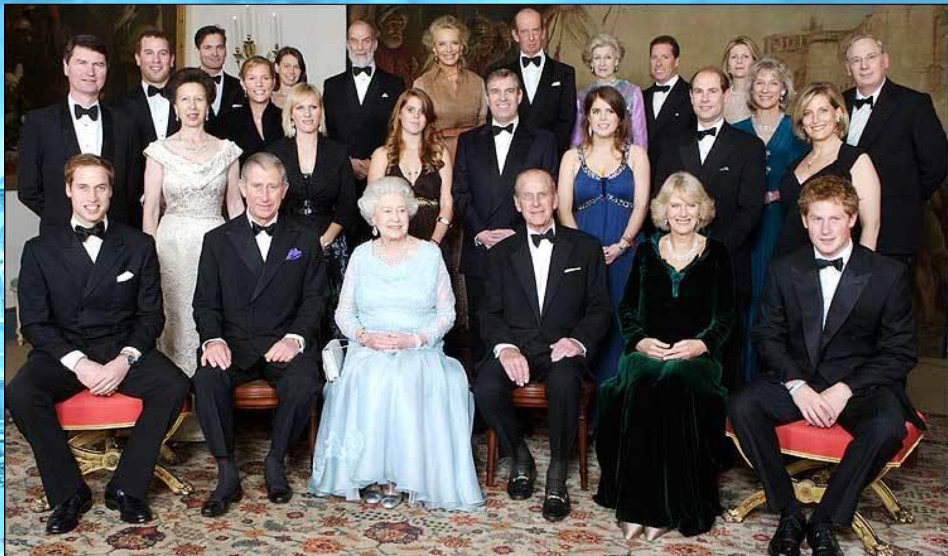
Члены королевской семьи (наши дни)