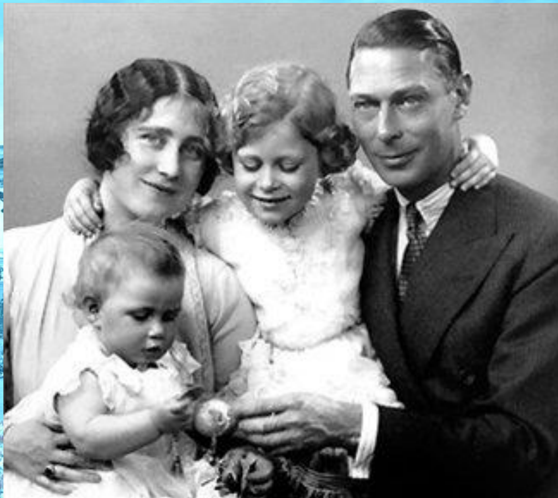
Принц Альберт, леди Елизавета Боуз-Лайон и их дочери Елизавета и Маргарет

Личность Елизаветы II сформировывалась на фоне всеобщей заботы и любви. С раннего детства ее воспитанию и образованию уделялось огромное внимание.