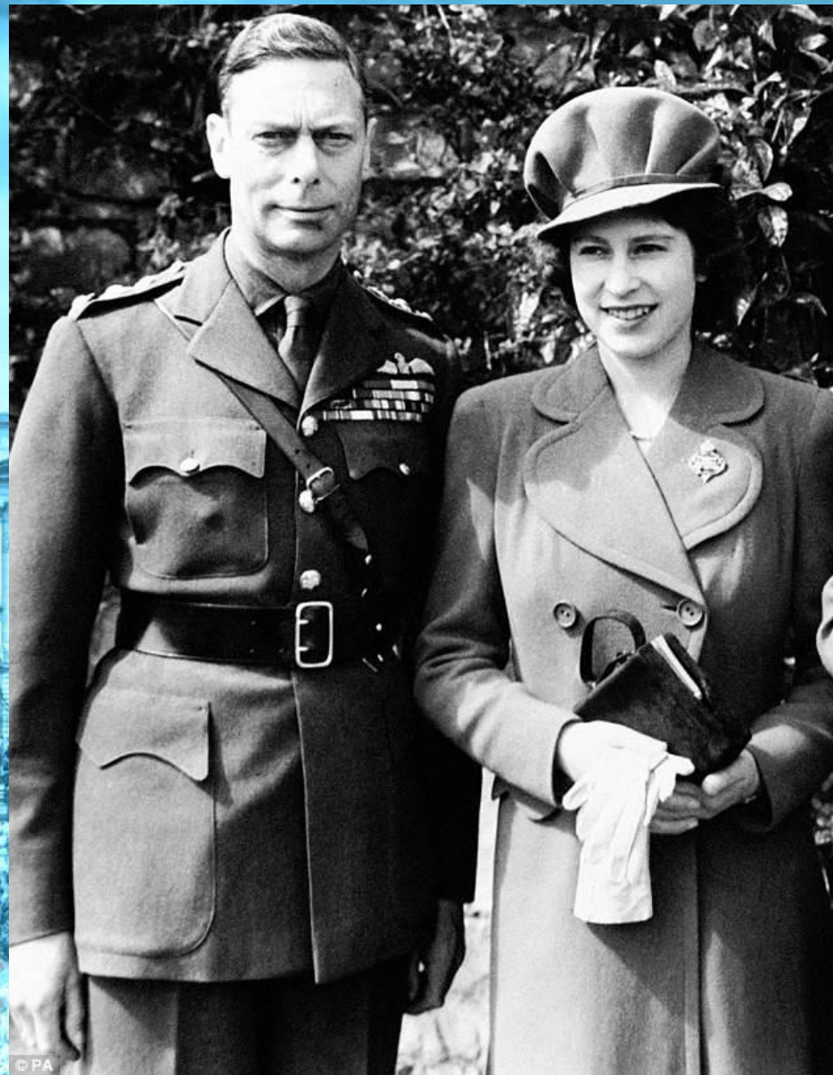
Принцесса Елизавета с отцом.

Король Георг VI умер 6 февраля 1952 года. Елизавета, находившаяся на отдыхе в Кении, была провозглашена королевой.